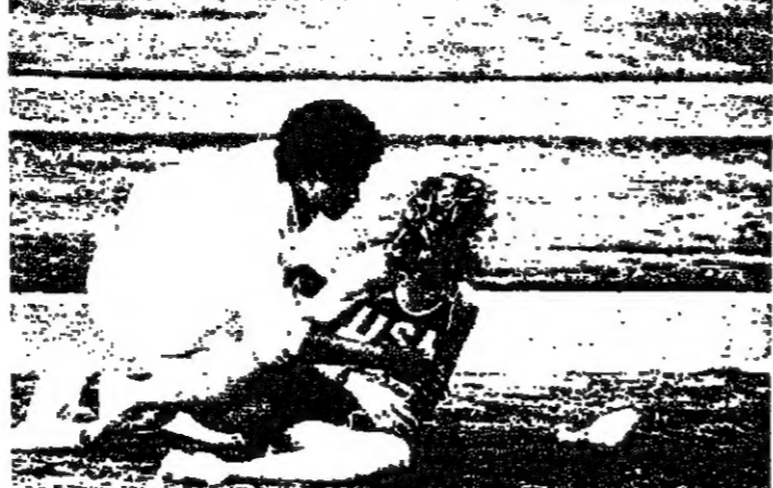
كلر لويس صاحب الذهبات الاولمبية الرابع